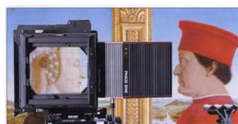
TOPPAN Uffizi Gallery